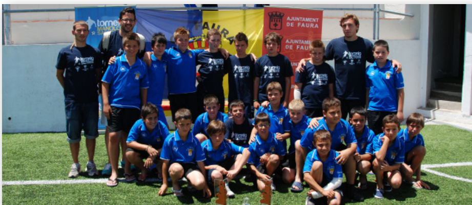
10 de juny. Equips de benjamins i alevins del Club de Futbol Faura al Torneig Manolo Salvador

A més d'estes activitats s'han celebrat la setmana del llibre, commemoració del bicentenari de la Constitució de 1812, xarrada informativa sobre les preferents, el Memorial d'Héctor Forner, els campus de pilota i futbol, cursos de natació.