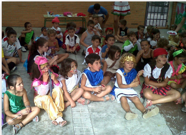
Del 2 al 27 de juliol. Xiquets i xiquetes a l'escola d'estiu.