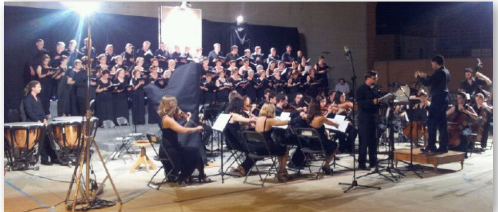
4 d'agost. Actuació de l'orquestra Ensemble Col legno al Vé Cicle de Música Vicent Garcés